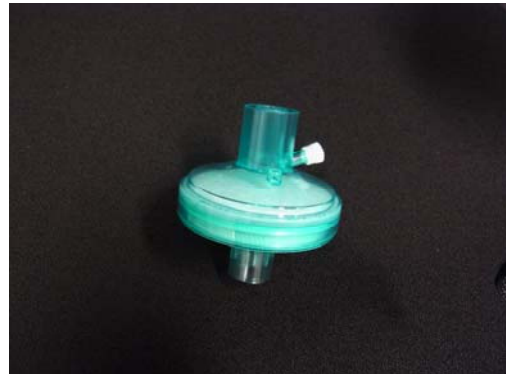
Kunstneus in beademingssysteem