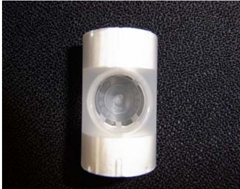
Kunstneus bij tracheostomaal gebruik tijdens spontaan ademen

Als een kunstneus direct op een tracheacanule wordt geplaatst terwijl er bovendien veel slijm in de luchtwegen zit, kan een flinke hoestbui de kunstneus volledig verstopen en moet deze direct worden verwijderd worden. Bij aanwezigheid van slijm kan de weerstand in het filter dusdanig toenemen dat de luchtpassage wordt belemmerd en de patiënt benauwd wordt.