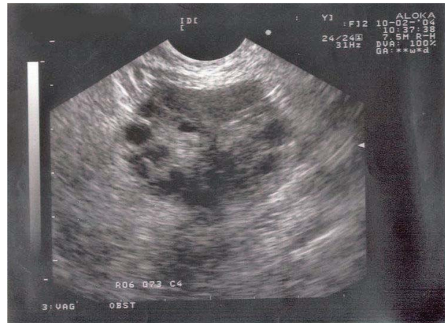
Figuur 1b. Echoscopische afbeelding van een eierstok zoals bij PCOS kan passen. Meerdere (tien tot twaalf) eiblaasjes zijn zichtbaar aan het oppervlak van de eierstok.